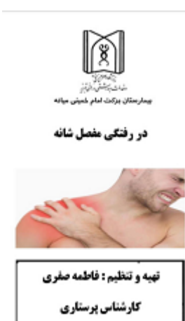
بمفلت در رفتگی مفصل شانه