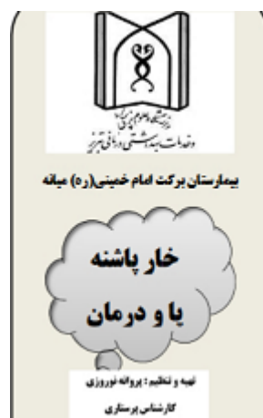
بمفلت خار پاشنه