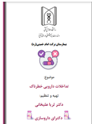
بمفلت تداخلات دارویی خطرناک