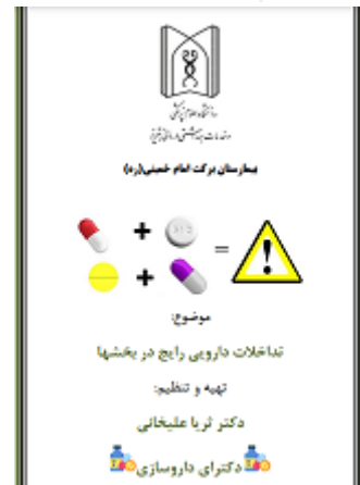
بمفلت تداخلات دارویی رایج در بخش ها