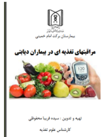
بمفلت مراقبت های تغذیه ای در بیماران دیابتی